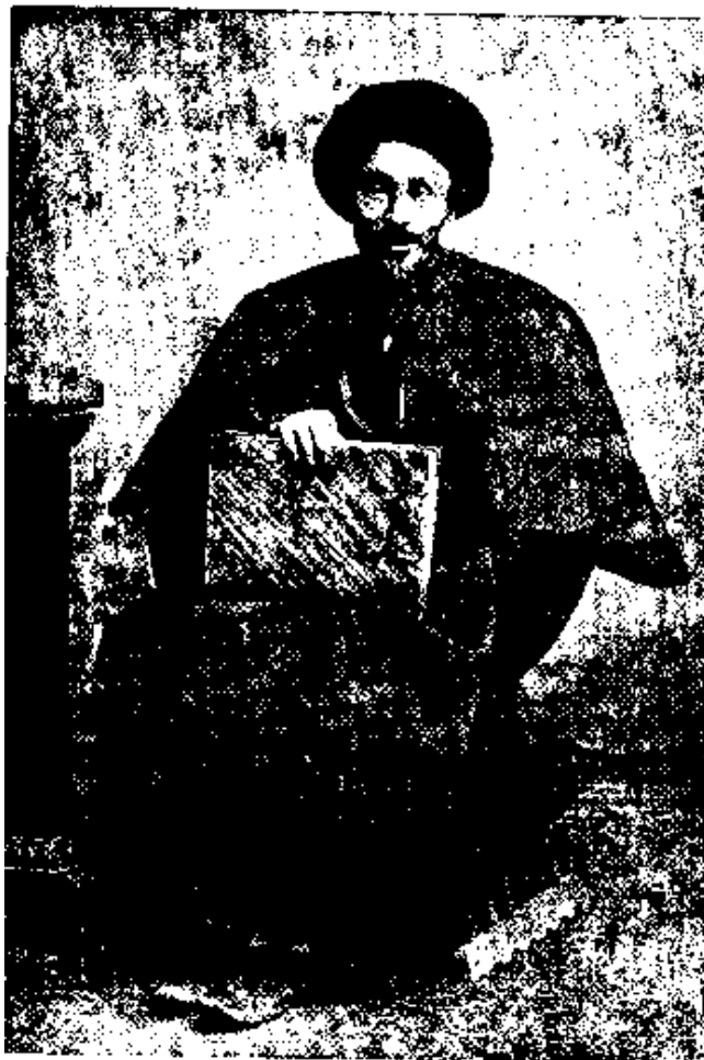
سید جمال الدین اسپهانی

پدرم اندامی باریک، بالایی میانه، ریش کوسج، رُخساره گندمی می داشت. از او پیکره نمانده ولی هر زمان چشمم به پیکره سید جمال الدین واعظ اسپهانی (واعظ مشروطه) افتد پدرم را به یاد آورم. در رخساره بسیار مانند هم میبوده اند. تنها چشم های پدرم درشت تر و دستاری که بسر میگذاشت کوچکتر می بود.