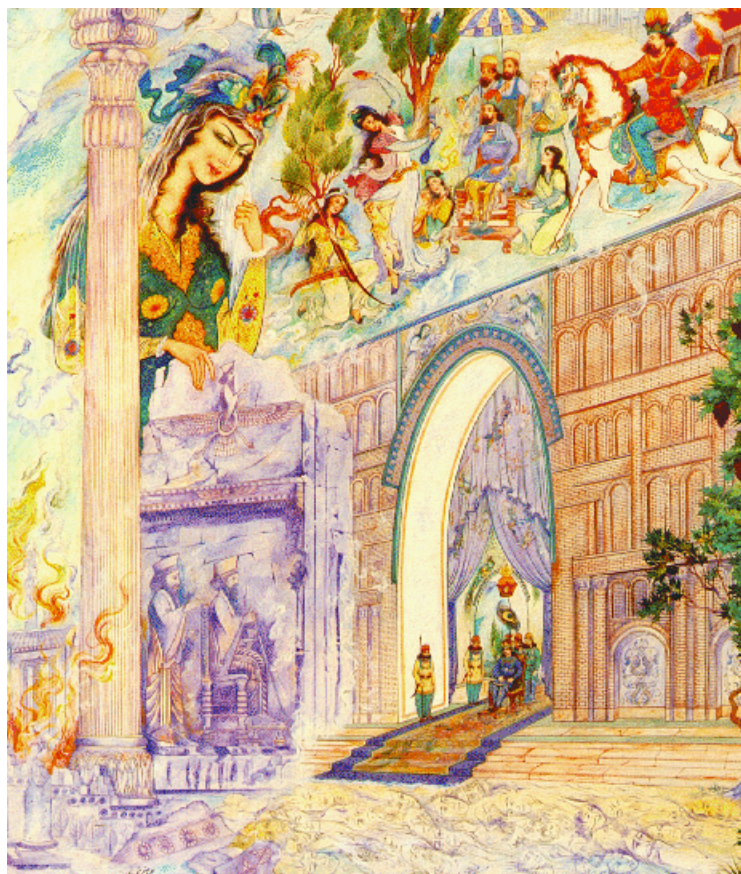
تابلوی ایوان مداین، کاخ یزدگرد، آخرین شهریار شاهنامه، پیش از آن که به دست اعراب ویران شود، اثر استاد علی اصغر تجویدی

پس از مرگ خسرو پرویز، پادشاه نیرومند ساسانی، چند شاه هر یک به مدت کوتاهی بر ایران فرمان می‌راندند. پس از این شاهان، نوبت به یزدگرد می‌رسد که شانزده سال با آیین نیکو و داد و دهش بر ایران پادشاهی می‌کند. در شانزدهمین سال پادشاهی یزدگرد، عمر، خلیفه ی اعراب، سعد وقاص را با سپاه زیادی برای جنگ با یزدگرد به ایران می‌فرستد. یزدگرد ارتش ایران را به فرماندهی رستم پسر هرمزد به مقابله ی اعراب می‌فرستد. رستم در جنگ کشته می‌شود و سپاهیان ایران به سوی بغداد (=تیسفون)، پایتخت ساسانیان، عقب نشینی می‌کنند. یزدگرد پس از رای زدن با موبدان و فرماندهان سپاه، بر آن می‌شود تا از بغداد به خراسان برود و در آن جا لشکر زیادی گرد آورد و سپس بازگردد و با قوای تازه نفس به اعراب حمله کند. اینک دنباله ی داستان یزدگرد را با هم می‌خوانیم.